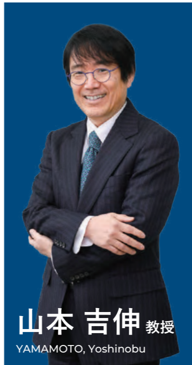
山本 吉伸 教授 YAMAMOTO, Yoshinobu