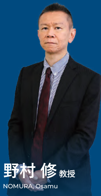
野村修 教授 NOMURA, Osamu

受講人数の目安 所要時間の目安 高校でご準備いただきたいもの 5~40人くらいまで 40~60分 プロジェクター、スクリーン