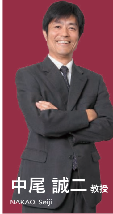
中尾 誠二 教授 NAKAO, Seiji

高校でご準備いただきたいもの プロジェクター、スクリーン、ワークに必要な道具や椅子・テーブルの配置等についてはワークの内容によってご相談